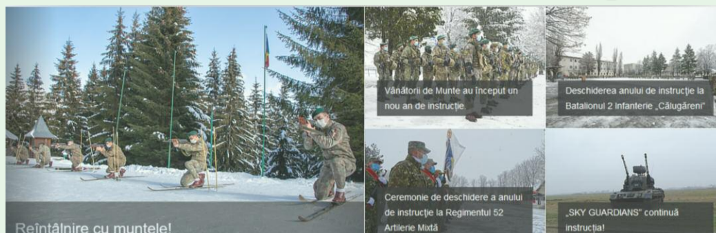
Reîntâlnire cu muntele!

Publicație editată de Divizia 2 Infanterie „Getica” Bulevardul Mareșal Alexandru Averescu nr. 1, Buzău www.armata-buzau.ro