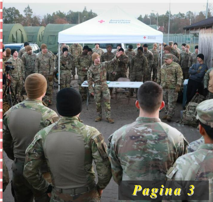
Militari români participanți la Norwegian Foot March