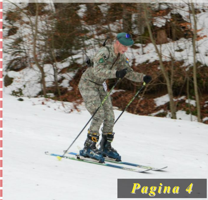
Concursuri aplicativ-militare de iarnă