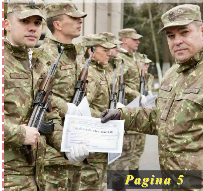
Black Sea Warriors s-au întors acasă